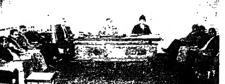
الاجتماع في مقره

تمنى اتحاد الحقوقيين المسلمين في لبنان على اعضاء لجنة الجنسية ان تتوصل إلى اقتراح مشروع متكامل ينصف المكنوميين واصحاب مائة اية الدرس، وينهي مخطط مأساة المكنوميين ادارياً، وان تأخذ بقاعدة سيد القضاء على مسائل الجنسية بعد تفرغ الشريط القانوني التي يتفق عليها والتخفيف من تدخل السلطة السياسية ما أمكن ذلك.